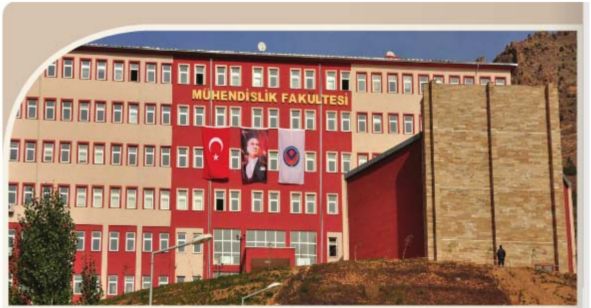
Şekil 1. Fakültemiz Hizmet Binasına Ait Bir Görünüm