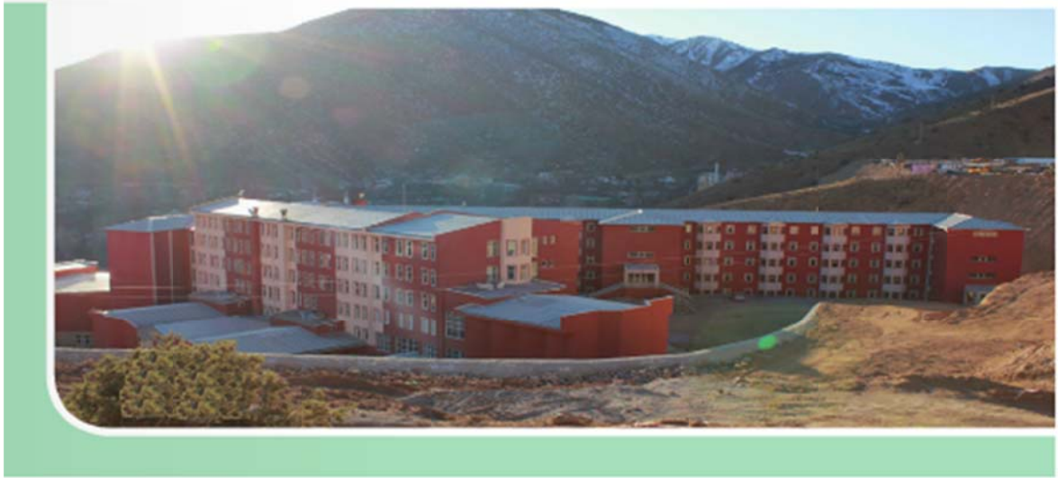
Şekil 2. Fakültemiz Hizmet Binasına Ait Bir Görünüm

Fakülte binamızda katlara bağlı olarak yerleşim düzeni aşağıdaki gibidir: